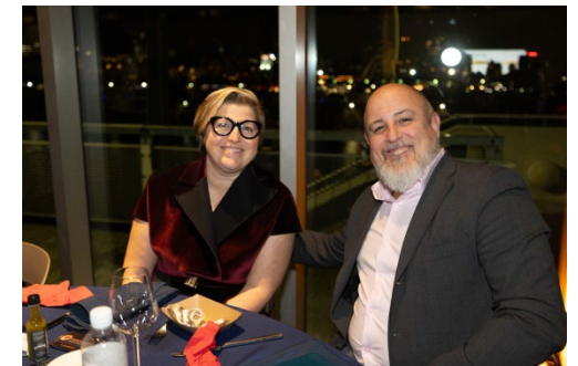
Envoi Automne-Hiver 2024-2025